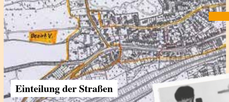
Einteilung der Straßen