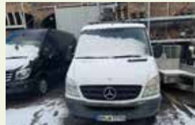
Mit dem Kleintransporter erhoffen wir uns Aufträge, die einen Beitrag zur Schulfinanzierung leisten

Wir haben von einem Gartenbaubetrieb günstig einen Kleintransporter erwerben können. Das 400 Kilogramm schwere Getriebe wurde zusammen mit ebenfalls schweren medizinischen Geräten eines begleitenden Projektes und mit üblichem Füllmaterial im Kleintransporter verstaut und als Mitfracht in einem Container per Schifftransport versendet. Wir hoffen, dass alles gut angekommen und vielleicht auch die Reparatur des Traktors schon erfolgreich abgeschlossen ist, wenn dieser Beitrag erscheint. Leider mussten wir einen erheblichen Teil der erhaltenen Spenden für diese unerwartete Aktion aufbringen. Unser Kleintransporter wird mit Transportaufträgen Geld verdienen und so einen Beitrag zur Schulfinanzierung leisten können.