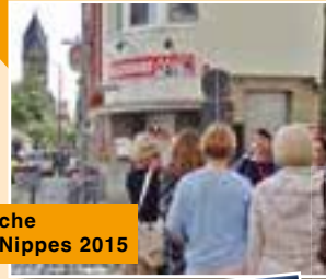
Kulinarische Führung Nippes 2015