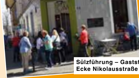
Sülzführung – Gaststätte Knollendorf Ecke Nikolausstraße

Ach so, JFG ist die Abkürzung für – JUNGE FRAUEN GRUPPE – das waren wir auch, als diese Gruppe gegründet wurde. Warum sollten wir den Namen ändern? Nur weil wir nun älter sind? Wir fühlen uns im Herzen noch jung! Doch wir würden uns auch freuen, wenn wieder Frauen dazukämen.