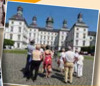
Ausflug zum Bensberger Schloss