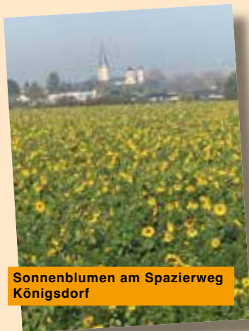
Sonnenblumen am Spazierweg Königsdorf

Möchte noch jemand zu unserer Gruppe dazukommen? Je mehr Frauen, desto mehr Themen. Herzlich willkommen!