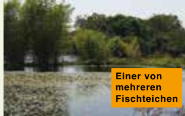
Einer von mehreren Fischteichen

anpflanzungen haben wir vor drei Jahren eine größere Fläche mit Kaffeebaum-Setzlingen bepflanzt, mit der Erwartung einer ersten Ernte ab 2028. Erfreulicherweise sind sie schon zu kleinen Bäumchen herangewachsen und tragen nach einer üppigen Blüte im Sommer bereits viele Bohnen, sodass wir uns auf eine erste Ernte schon in diesem Jahr 2026 freuen können. Gerne möchten wir diese erfolgreiche Anpflanzung weiter ausbauen.