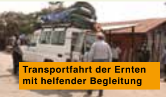
Transportfahrt der Ernten mit helfender Begleitung

Diese Vorhaben können wir nur Schritt für Schritt weiterverfolgen, wenn wir hierzu die finanzielle Unterstützung haben, die uns beispielsweise auch zum Kauf von weiterem Saatgut verhilft, so zum Beispiel auch für das Anlegen von Reisfeldern. Dafür gibt es durch eine gute Wasserversorgung ideale Voraussetzungen.