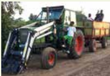
Transportfahrt der Ernten mit helfender Begleitung

In der letzten IM TEAM-Ausgabe ist berichtet worden, dass im Sommer 2025 ein Traktor aus Frechen mit einigem Zubehör per Container im Kongo angekommen ist. Wie ist der aktuelle Stand?